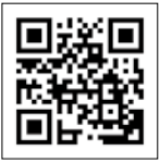
▲恵那食農ポータルサイト「たべとる」

□申し込み方法 市ウェブサイトから申し込み。 □申し込み期限 7月15日(土)午前10時〜正午 □申し込み方法 市ウェブサイトから申し込み。 □申し込み期限 7月15日(土)午前10時〜正午