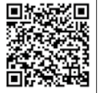
▲市ウェブサイト猫の不妊去勢費用の補助

申請が必要です。 □補助対象者 市内在住の個人、自治会など、市に団体登録をした動物愛護団体 □補助対象猫 動物病院で不妊去勢手術と耳カットを実施した猫(飼ひ猫は除く) □補助額 ▽不妊手術11600円/匹 ▽去勢手術114000円/匹