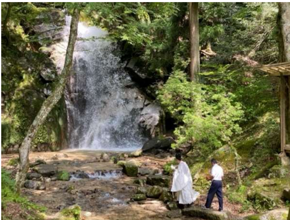
昨年度の滝開きの様子（写真）

その他、三郷町での軽トラ市のほか、恵那峡花火大会など各種イベントで特産品を販売し、地域振興を進めています。