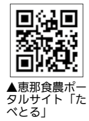
▲市ウェブサイト「たべとるマルシェ」