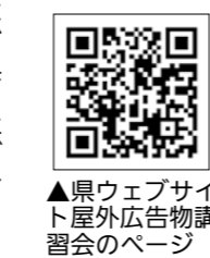
▲県ウェブサイト屋外広告物講習会のページ

受講者には、屋外広告物の許可期間を更新する時に必要となる、屋外広告物講習会修了証書が交付されます。 □とき 9月22日(金)午前9時半〜午後5時(受け付けは9時半から) □ところ 岐阜市生涯学習センター(岐阜市) □定員 99人(先着順) □料金 3000円