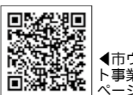
▲市ウェブサイト事業系ごみのページ

収集運搬業者 大井町・長島町・東野・三郷町・武並町・笠置町・中野方町・飯地町 ・(株)恵那清掃工業 ☎26-4607 ・(株)クリーン恵那 ☎28-3551 岩村町・山岡町・串原・上矢作町 ・ケイナンクリーン(株) ☎43-4122 明智町 ・(有)酒井 ☎25-0088 ・(株)国本商店 ☎54-2303 □環境課(内線208)