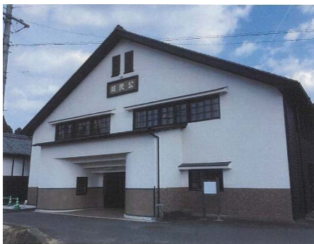
宮盛座正面の塗装