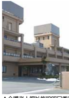
▲介護老人福祉施設明日香苑

2億5416万円 建設から20年以上経過している介護老人福祉施設明日香苑と福寿苑の大規模改修を行います。