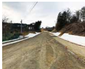
▲主要な市道を整備