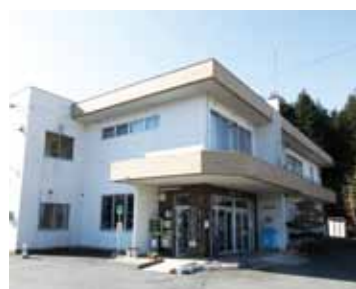
▲三郷コミュニティセンター