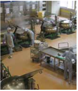
▲子どもたちへ安全な給食を提供

1910万円 食物アレルギーを持つ園児や児童、生徒に対応できるように、学校給食センターにアレルギー対応給食室を建設するための準備を進めます。