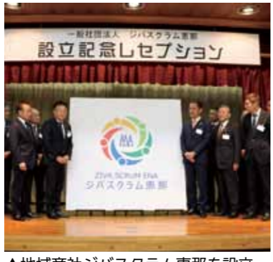
▲地域商社ジバスクラム恵那を設立