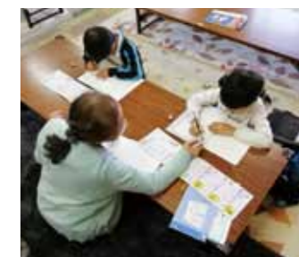
▲放課後児童クラブで学習する児童