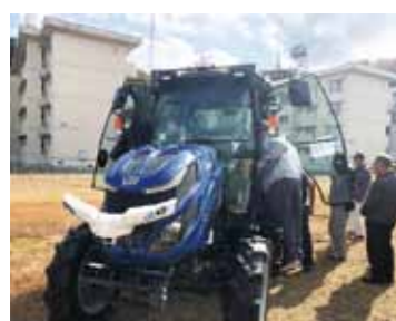
▲スマート農業の導入を支援