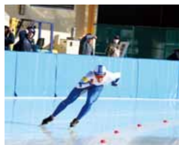
▲スケート競技強化育成選手