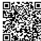
▲ちなまのまちづくり市民活動事業の補助金