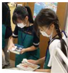
▲「こども司書講座」で、図書館の仕事を体験