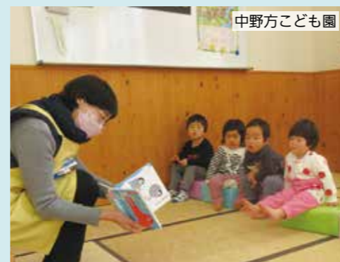
地域の読書活動団体による読み聞かせ。未満児から年長児まで、どのクラスでも人気。