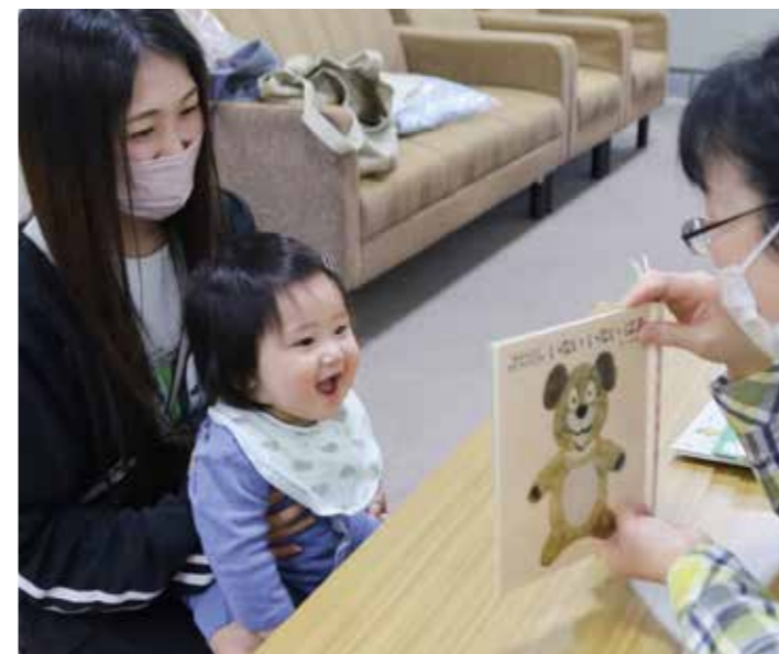
▲保健センターでの7カ月児教室に合わせ「ブックスタート」を実施

16年目を迎えた図書館 市中央図書館が開館して16年。これまでの貸出冊数は、累計で31万冊にもなり、多くの市民に親しまれてきたことが分かります。図書館では、子どもたちに心豊かに育ってもらいたいと、子どもの読書活動にも力を入れてきました。平成21年に策定した「子どもの読書活動推進計画」(現在3期目)では、読書の機会の提供、読書環境の整備、人材育成を柱とし、豊かな人間性を育もうとしています。