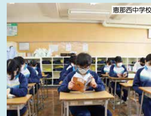
市立の全小中学校で、朝読書が行われています。学校中が静けさに包まれるひととき。

子どもたちの読書環境 図書館以外でも、子どもたちはたくさん本に触れています。市中央図書館から定期的に配本されており、コミセンの図書室や学校での読書環境も充実しています。ボランティアやPTAによる読み聞かせも多く行われています。ここでは、子どもたちの多彩な読書活動の一部を紹介します。