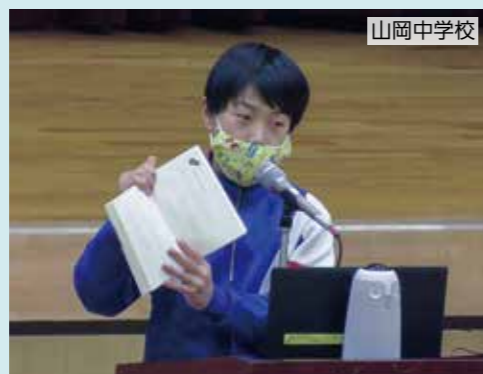
山岡中学校では「ビブリオバトル」を開催。学年ごとの予選を経て、チャンプ本を決定します。