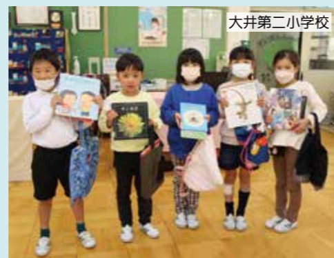
子どもたちは、学校や園でも本を借りています。休み時間には、本袋を持って図書室へ。