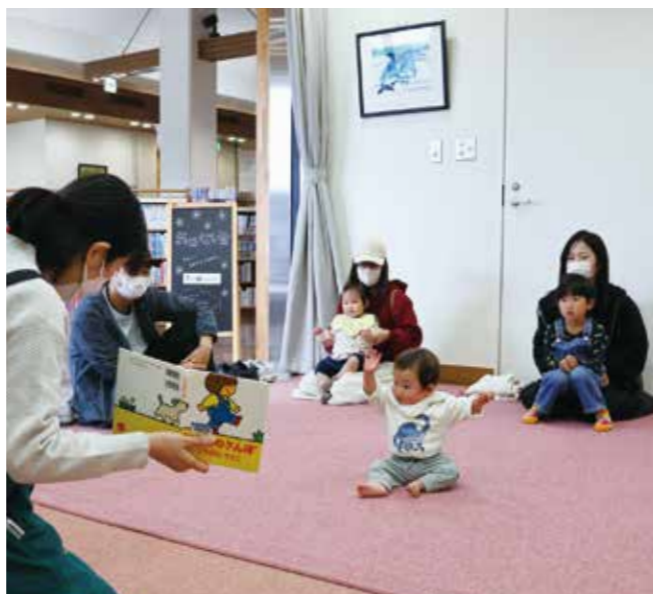
▲司書やサポーターによる「おはなし会」は、週2回行われる

校巡回司書によるブックトークを行い、授業に関連する本を紹介することで、関心を広げ理解を深める取り組みをしています。さらに「こども司書講座」や、小学生から大学生までが活動する「えなとクラブ」で興味を深め、同年代の目線で広めていけるよう支援しています。 読書活動を支えるサポーター こういった活動に欠かせないのがボランティアの存在です。「図書館サポーターえな」は平成21年に設立され、現在59人と4団体が登録。興味や得意分野を生かして活動しています。子ども向けにも、読み聞かせやイベントなどを通じて、本に親しむきっかけづくりをしています。読書の楽しさを広める取り組み。あなたも一緒に活動しませんか。