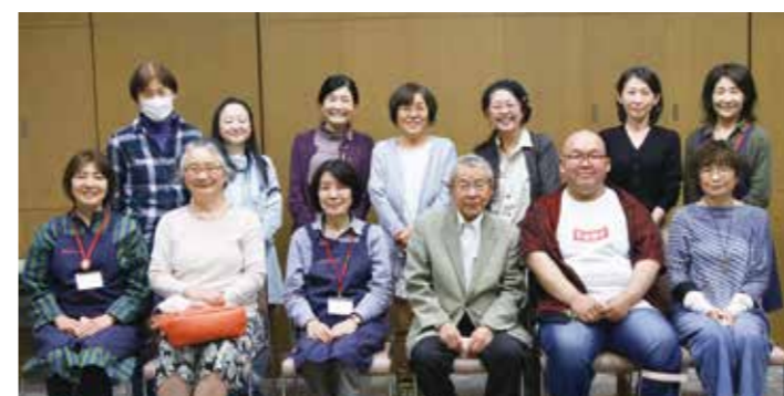
▲図書館サポーターの皆さん。本に親しむ多彩なイベントを企画