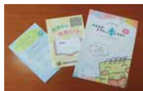
▲成長に合わせ、お薦め本のリストをプレゼント

成長に寄り添いながら 図書館が子どもの読書活動を進める中で大切にしているのが子どもの成長段階に応じた、読書へのきっかけづくりです。乳幼児に絵本をプレゼントする「ブックスタート」では、司書とボランティアが実際に絵本を読み、気に入ったものを選んでもらっています。絵本の楽しさが分かり始める3歳児には、保護者に読み聞かせの良さを伝えながら「えほんのおもいで」冊子を配布。読書記録に利用してもらおうとともに50冊に到達すると絵本をプレゼントしています。小学校入学時には「子どもが好きな本リスト」を配布し、成長に合わせた本選びの手助けもしています。園には司書が訪問して読み聞かせをする他、小中学校では学