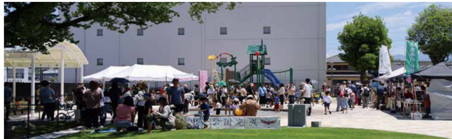
▲6月3日のリニューアルオープンイベントでは、親子連れでにぎわう