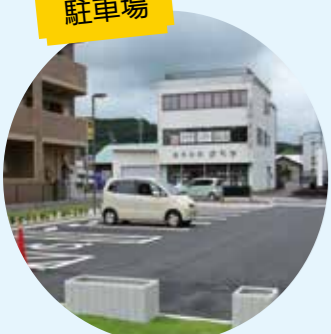
▲新しく整備した駐車場には、8台駐車可能