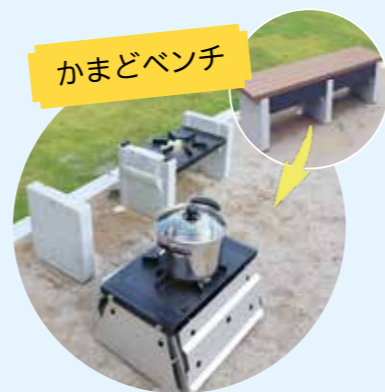
▲災害が起きた時には、ベンチがかまどに変身。炊き出しで活用できます