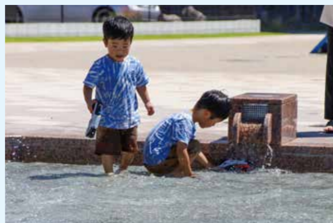
▲浅いので、思い切り水をじゃぶじゃぶして遊べます。水の中に入らずに、おもちゃを浮かべても楽しいよ！ 冬は水を抜いてしまうので、夏のうちに遊んでね