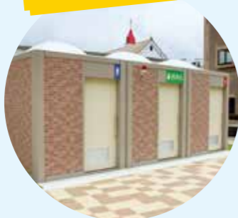
▲きれいに生まれ変わりました。おむつ替えシートも完備