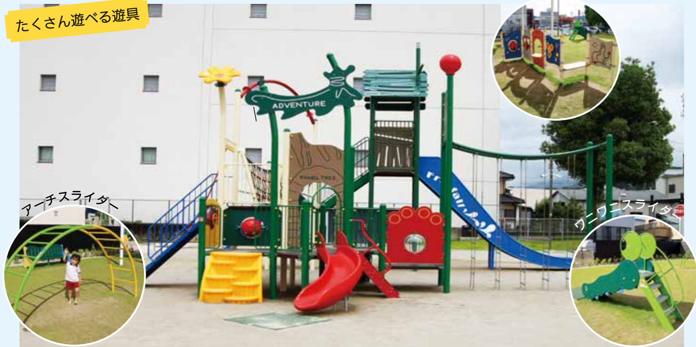
▲公園内には、年代に合わせた魅力的な遊具が。幼児用遊具のワニワニスライダーやアーチスライダーの他、公園の中心には、V字ブリッジやにこにこパネル、小枝わりなどの遊具が一つになった大型遊具があり、遊び方は無限大！