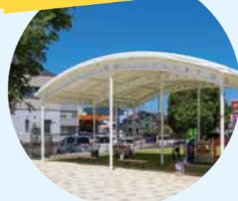
▲屋根付きで公園内を見渡せる位置にあり、子どもたちの見守りもできます