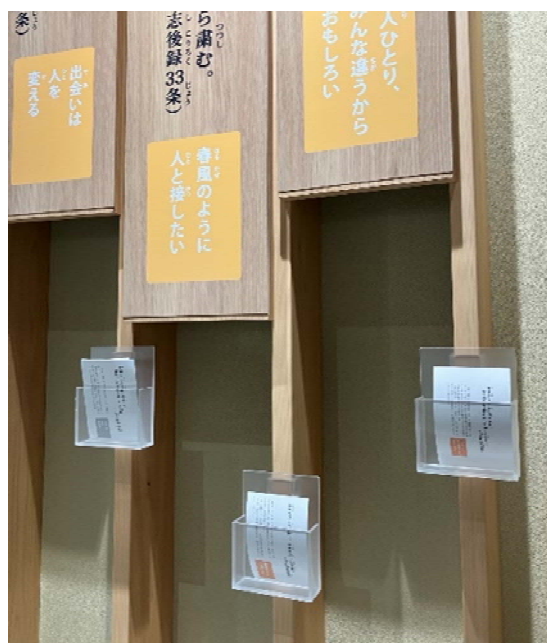
言葉のカードの掲示