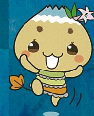
恵那市公式キャラクター エーナ