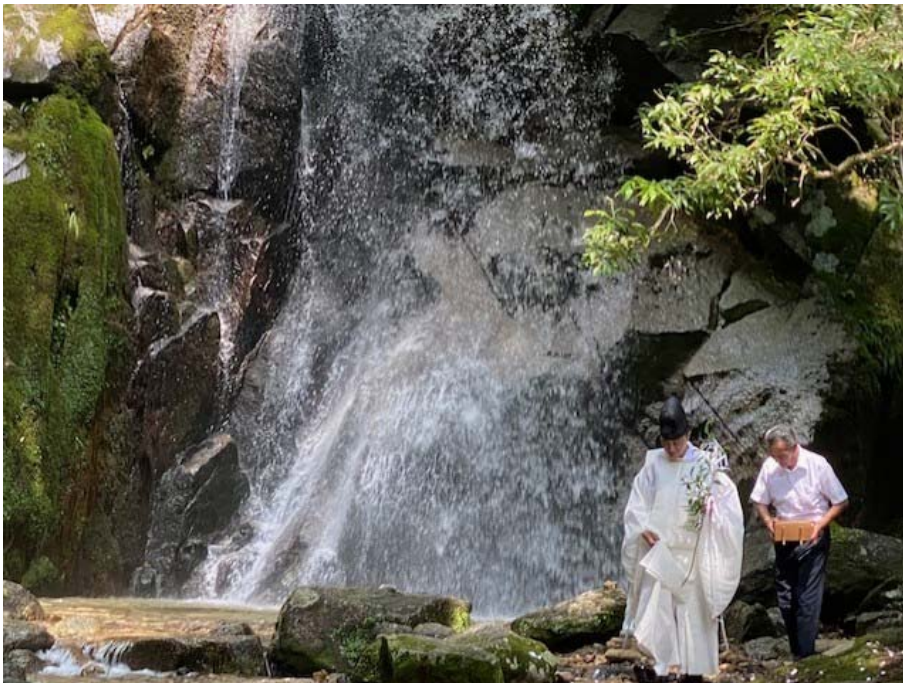
昨年度の滝開きの様子（写真）

8月のお盆期間には、現地で五平餅などを販売しています。本年は8月11日（火曜日）から16日（日曜日）までの6日間、出店する予定です。