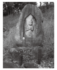
▲中山道にたたずむ馬頭観音