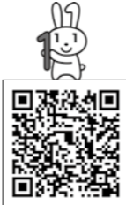
▲市ウェブサイト「臨時申請窓口」のページ

市のイベントや行事の会場でもマイナンバーカードを申請できます。顔写真を無料で撮影し、マイナンバーカード申請を手助けします。