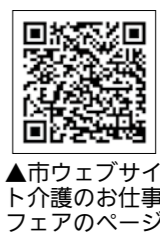
市ウェブサイトのお仕事フェアのページ

□ ところ 恵那文化センター ※参加事業所など詳しくは市ウェブサイトを確認ください