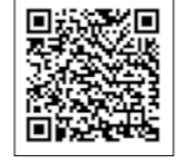
▲市ウェブサイト恋活inENAのページ

男女の出会いの場を提供する婚活イベントを実施する団体を募集します。実施団体には、事業に関する費用の一部を補助します。