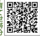
▲市ウェブサイトひとり親世帯分のページ

□対象 次のいずれかに該当する世帯①公的年金などを受給している世帯②収入が減少し、児童扶養手当受給者と同水準の収入となった世帯