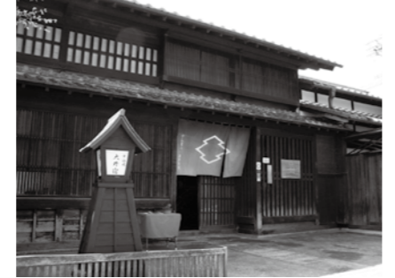
▲ひし屋資料館で抹茶をいただく

市茶道連盟による抹茶のおもてなしを行います。当日は、入館料が無料です。 □とき 6月25日(日)午前10時～午後3時 □ところ 中山道ひし屋資料館