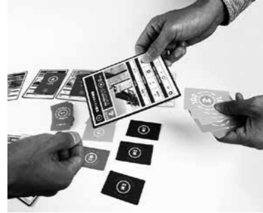
▲カードゲームで楽しく学べます