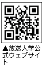
▲放送大学公式サイト

4、ハローワーク恵那(恵那公共職業安定所) 026-1341 放送大学の10月入学生を募集 放送大学は、テレビやインターネットで授業を行う通信制の大学です。詳しい資料を郵送しますので、気軽に問い合わせください。 教養学部 □種類 ▽科目履修生 11年 □履修 ▽選科履修生 11年 □間在学し希望する科目を履修 ▽全科履修生 11年 □以上在学し卒業を目指す □料金 入学科7千円～2万4千円、授業料1万1千円/科目 大学院 □種類 ▽修士科目生 11年 □履修 ▽修士選科生 11年 □間在学し希望する科目を履修 □料金 ▽入学料 1万4千円～1万8千円 ▽授業料 2万2千円～4万4千円