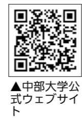
▲中部大学公式サイト

古代メソポタミア文明をオンラインで学べます。詳しくは中部大学ウェブサイトを確認ください。 □とき ①6月29日(木) ②7月6日(水) ③7月13日(水) 午後3時～4時半 □料金 1500円/回 ※①は受講料無料です □申込期限 ①6月26日(月) ②7月3日(月) ③7月10日(月)