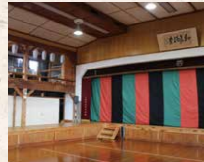
▲改修された宮盛座内部

宮盛座は、三郷町佐々良木にある芝居小屋です。佐々良木地区では地芝居が盛んで、古くから、武並神社や諏訪神社の拜殿で地芝居が披露されていました。明治時代末頃、武並神社境内、現在の忠魂碑のある辺りに、宮盛座は建てられました。当時の写真を見ると、役者の後方の幕に、明治30年11月吉日という文字が見え、建築はその頃と思われる。廻り舞台、花道などを兼ね備えた施設で、映画や歌舞伎が行われる地元の娯楽場所でした。その後、太平洋戦争の激化により、昭和17年頃には軍用工場として利用するため、解体されてしまいました。戦争が終わると、芝居小屋の復活が住民から持ち上がります。そして昭和28年、旧三郷町の公民館建設にあたり、芝居小屋と会議室を兼ね備えた、今という複合施設として、宮盛座は再建されました。廻り舞台はないものの、花道があり、二階には棧敷席を設け、以前の芝居小屋が再現されました。別棟には楽屋兼用の会議室と和室も備えました。ここでも映画や歌舞伎が行われ、幼い頃に父の膝で映