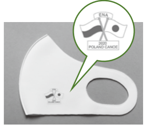
▲ワンポイントでポーランド共和国と日本国旗のクロスロゴ入り