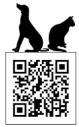
県ウェブサイト 多頭飼養届出 制度のページ

頭以上飼養している方) ※第一種動物取扱業を営んでいる方を除く □変更の届け出 多頭飼養の届け出事項に変更があった日から30日以内 □廃止の届け出 飼養を廃止したとき、飼養数が10頭未満になったときは、速やかに届け出てください。 ※詳しくは、恵那保健所か県ウェブサイトを確認ください 恵那保健所 26-1111 環境課(内線208)