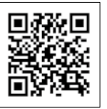
▲地芝居大國ぎふWebミュージアムのページ