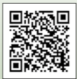
▲市ウエブサイト「WRCのページ」