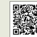
▲介護保険料減免のページ