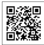
▲多治見砂防国道事務所ウェブサイト