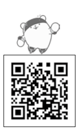
▲恵那スケート場ウェブサイト

□その他 土・日、祝日と夏休み期間中(7月21日(水)～8月25日(水))は、来場前に恵那スケート場ウェブサイトです。事前予約が必要です。 ※教室に申し込みした方は、事前予約は不要です