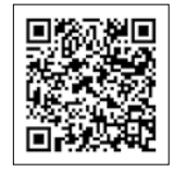
▲市ウェブサイト ト食用廃油の回収のページ

てんぷら油の回収 □とき 7月10日(土)～12日(月) 8月7日(土)～9日(月) □ところ 各収集所