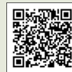
▲国民健康保険料減免のページ