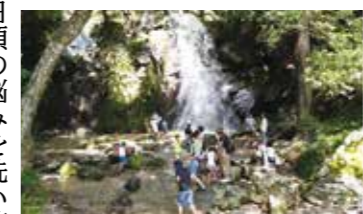
▲暑い日は、冷たい水が気持ちいいんだナ! (おととしの様子)

冷たいから、毎年夏には家族連れが涼を求めて訪れ、水遊びを楽しむ姿がたくさん見られるんだって。滝のしぶきに当たると、暑さや日頃の悩みを洗い流してくれそうなんだナ。エーナも友達と水遊びを楽しもうかな。あ、そうそう、川の石はとても滑りやすいから、遊ぶときは気を付けてね。 寿老の滝には、市役所から車で30分くらいで行けるよ。途中には「道の駅そばの郷らっせいみさと」があるから、ドライブにもお勧めなんだナ。これからの季節、ぜひ訪れてほしいんだナ。