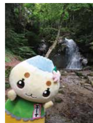
▲森林浴にも最適なんだナ!

夏至を迎え、だんだん暑い日が増えてきた今日の頃。涼しくて、癒しの場所を求めて、三郷町と山岡町の境、屏風山の麓にある寿老の滝に行ってきたんだナ。寿老の滝という名前は、明治時代に付けられたそう。西濃地方の養老の滝に対して、老いを寿ぎ、長寿を祝うという意味が込められているんだよ。