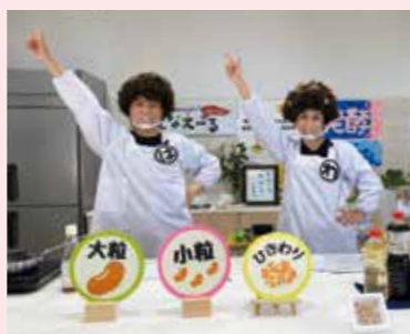
▲えなえーるキッチンからお届けします