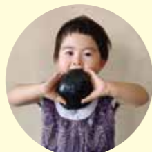
▲迫力のばくだんおにぎり