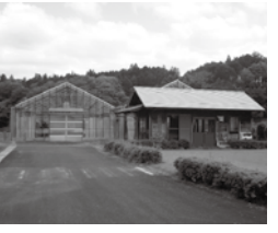
▲市山岡花・野菜育苗施設

市山岡花・野菜育苗施設 募集要項 8月1日(日)から31日(火)まで市ウェブサイトに掲載 指定管理開始日 令和4年3月1日 申し込み方法 募集要項の