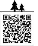
▲市ウェブサイトコンテスト募集のページ