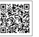
▲市ウェブサイト ト岩村歴史資料 館のページ