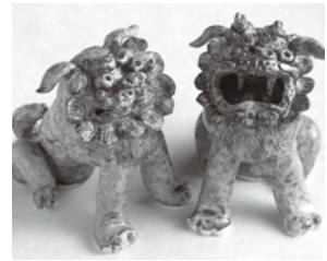
▲陶器で作るシーサー (高さ約9センチ)