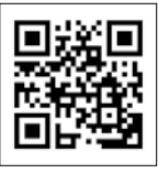
▲恵那食農 ポータルサイト 「たべとる」