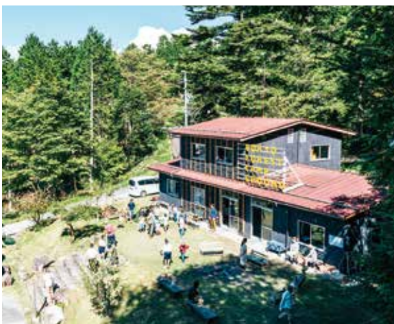
▲改装した管理棟は、利用者が集うキャンプ場のシンボル

思いを胸に8年ぶりに地元へ戻り、中学校の教員に転身。赴任先で担任を持つなど子どもたちと4年間を過ごした。教員生活はとても充実していたが、違う道に進んだ