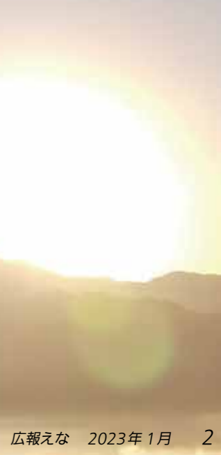
背景：東雲橋（笠置町）から見た日の出