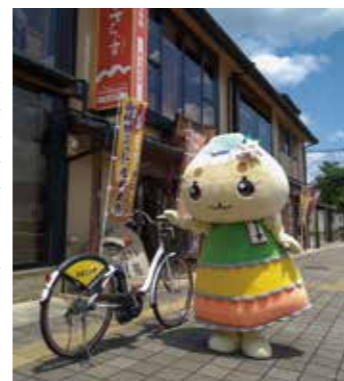
▲電動アシスト付きで楽に乗れる

使おうと思ったら、まず会員登録をしてね。最初に登録すれば、いつでも使うことができるんだって。登録するときに決済方法も指定するから、料金も自動で引き落としになるよ。便利だね。 自転車は、電動アシスト付き。坂道でもスイスイこけて、楽に乗れたよ。天気も良くて、気持ちよかったな。 みんなも、市街地のちよつとした移動に、ぜひシェアサイクルを利用してみてね。