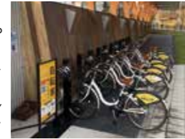
▲自転車のステーション

シェアサイクルって、知ってるかな？ みんなで自転車をシェア(共有)するサービスで、市内では、昨年8月から始まっているよ。