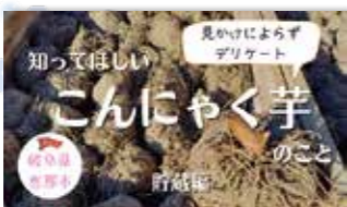
▲コンニャク芋を知ろう(貯蔵編)