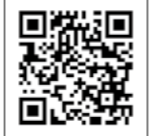
▲県ひとり親家庭等就業・自立支援センター