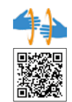
▲広報えなを手話で読む