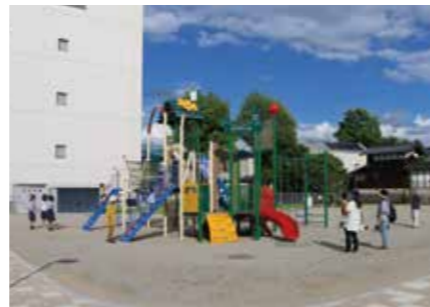
▲地域公園（イメージ）