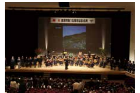
▲令和元年の市制15周年式典