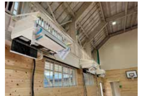
▲ガスヒートポンプ式空調設備