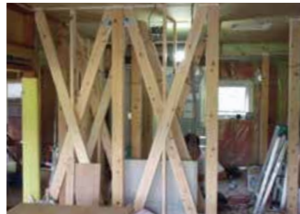
▲木造住宅耐震化補強工事