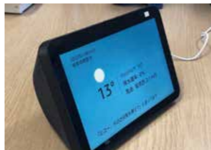
▲スマートスピーカー