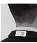
▲衣服に貼られた見守りシール ※QRコードは、デンソーウェーブの登録商標です

☎・☎ 地域包括支援センター 26-6828、恵南地域包括支援センター 26-6865