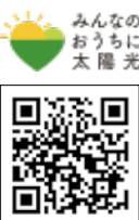
▲共同購入専用ウェブサイト

■県による共同購入 県と協定を締結したアイチューザ1(株)が、太陽光パネルなどの共同購入者を募集しています。一括発注するため、お得に購入できます。 □対象 次のいずれかのプラン ①太陽光パネルのみ ②太陽光パネルと蓄電池 ③蓄電池のみ □参加登録 9月4日(水)まで □参加方法 専用ウェブサイトから参加登録をする。 ※登録しても購入義務はありません □その他 市の補助金を利用できる場合があります。