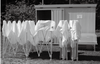
▲購入したテントやアルミベンチなど

飯地自治区協議会では、宝くじの助成金を活用し、テントやアルミベンチなどを購入しました。 購入した備品は、イベントで活用します。 宝くじ事業は、（一財）自治総合センターが、宝くじの社会貢献広報事業として宝くじの受託事業収入を財源に行っています。 ☎ 地域振興課 ☎26-6810