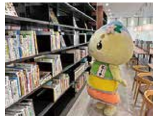
▲学び合える新しい形の図書館

次に向かったのは市中央図書館岩村分館。市内南部の読書拠点として新しくオープンしたんだナ！ 郷土の先人に関する本など、約8000冊が入られるよ。館内にはおしゃれなソファ席やカウントー席が並んでいて、とっても心地良かったんだナ！ エーナのお気に入り日は、日なたぼっこができるテラス。おしゃべりや飲食ができるスペースもあるから、本を読みながら家族や友達と過ごすのにもぴったりだよ。 新しく出来た二つの施設。岩城下町にも近いから、まち歩きを楽しみつつ遊びに来てね！