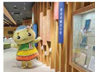
▲言志四録を楽しく学べるよ！

みんなは「佐藤一斎學びのひろば」と「市中央図書館岩村分館」には、もう遊びに行ったかな？ 本年10月、旧岩村振興事務所が二つの「まなぶ」拠点施設に生まれ変わったんだナ！ 今回エーナはオープンしたばかりの施設を早速探検してきたよ！ まず向かったのが佐藤一斎學びのひろば。郷土の先人・佐藤一斎の言葉や教えを体感できる場所なんだって。佐藤一斎の書いた『言志四録』の言葉が降り注ぐシアターや、質問に答えると佐藤一斎があなたにぴったりの言葉を教えてくれる「対話式コトバ診断」は必見！ 心に響く言葉がきつと見つかるはずだよ。