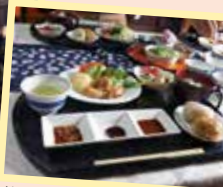
芋ごね餅をいただきました！