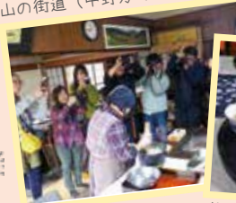
山の街道（中野方町）で食文化体験