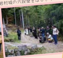
岩村城の六段壁をばしやり