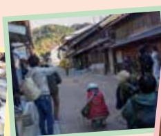
岩村城下町を散策