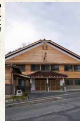
▲歌舞伎小屋「五毛座」(飯地町)

有形文化財のうち、特に保存や活用のための措置が必要とされるもので、本市では、国指定の旧恵那市役所飯地事務所庁舎、同サイレン塔、五毛座、日本大正村役場が挙げられます。