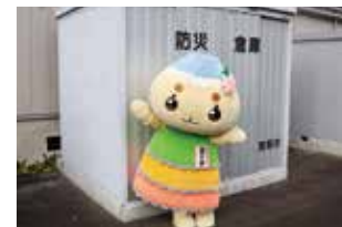
▲家の近くだと、どこにあるかな？

のわかめごはんができあがり！災害の時でも温かいごはんが食べられるって、うれしいね。 指定避難所に設置されている防災倉庫は、市内90カ所にあつて、普段は地域の方が管理しているよ。地域によっては、防災訓練で簡易トイレを組み立てたり、非常食を試食したりするんだって！ 普段から倉庫に何が入っているかを知って、避難生活の練習をしておくとか、いざという時にとっても安心なんだナ。市のハザードマップには、防災倉庫の位置が書いてあるから、家の近くにある倉庫を確認してみてね！ 問 危機管理課 ☎26-6805