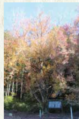
▲富田ハナノキ自生地(岩村町)

指定の富田ハナノキ自生地、ヒトツバタゴ自生地、傘岩、県指定の大船神社の弁慶スギ、笠置山のヒカリゴケが挙げられます。