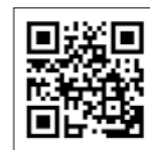
▲恵那食農ポータルサイト「たべとる」