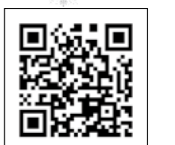
▲恵那スケート場ウェブサイト