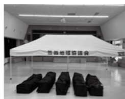
▲新しくなったテント

笠置地域協議会では、宝くじの助成金を活用し、物置やテントなどを整備しました。宝くじ事業は、（一財）自治総合センターが宝くじの社会貢献広報事業として宝くじの受託事業収入を財源として行っています。整備した備品は、各種イベントで活用します。