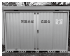
▲新しくなった物置