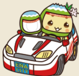
▲エーナのコ・ドライバーになれるよ!