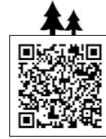
▲市ウェブサイト コンテストの 募集ページ

□申し込み方法 ▽一般の部 ▽林政課か市ウェブサイト ▽林政課か市ウェブサイト ▽林政課か市ウェブサイト ▽林政課か市ウェブサイト ▽林政課か市ウェブサイト ▽林政課か市ウェブサイト □申し込み方法 ▽一般の部 ▽林政課か市ウェブサイト ▽林政課か市ウェブサイト ▽林政課か市ウェブサイト ▽林政課か市ウェブサイト ▽林政課か市ウェブサイト