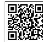
▲ヤフー公式の 防災ランドの ページ

□持ち物 身体障害者手帳 □申し込み方法 電話か直接 申し込む。 ☎・☎ 社会福祉課(西庁舎 1階、内線189) ヤフーで防災について 学びませんか Yahoo!の子ども向け サイト「ちよポットの防災ラ ンド」は、災害に関する正し い知識を、クイズ形式で楽し みながら学べます。夏休みの 学習にぜひ活用ください。