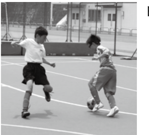
▲子どもたちの熱い戦い