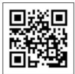
▲恵那食農ポータルサイト「たべとる」