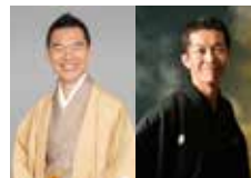
▲柳家花緑 ▲柳家三三

清く明るく人柄が、落語を通じて観客の心を震わす、これぞプリンス柳家花緑。正統派古典落語から軽妙な小断りまで、自在に操る落語の名手柳家三三。次世代の落語界を牽引する2人のそりい踏みです。