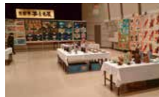
▲多くの作品を展示

令和5年12月5日(土)~28日(日)の恵那文化センター大ホール・集会室・展示室の施設予約は、令和4年12月1日(日)午前9時から。重複の場合は利用者同士で調整を行い、調整が付かない場合は抽選で決定します。抽選は直接来館した方が対象です。