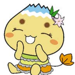
恵那市公式キャラクター「エーナ」

■ 問合せ先: 恵那市役所 高齢福祉課 介護保険係 0573-26-2111 (代)