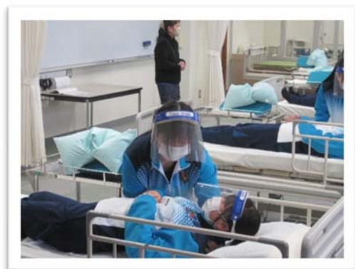
恵那南高校 介護実習