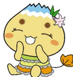
恵那市公式キャラクター「エーナ」