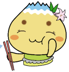
恵那市公式キャラクター エーナ