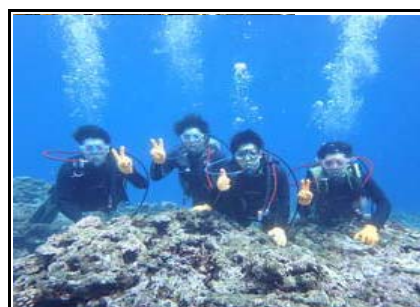
社員旅行(2019年宮古島)