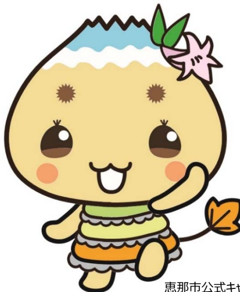
恵那市公式キャラクター「エーナ」

恵那市観光振興補助金は、恵那市の観光振興を促進するため、補助対象事業者が行う事業に、恵那市が予算の範囲内で補助金を交付するものです。