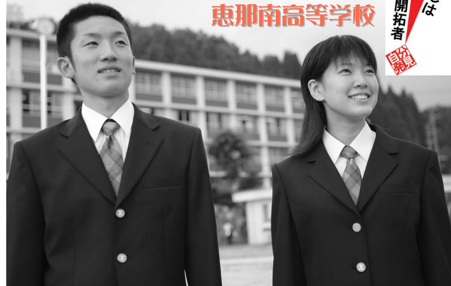
▲恵那南高等学校の新制服（モデルは明智商業高等学校の生徒です）

恵那南高等学校は、総合学科として初めて「進学系列」を設け、大学進学を目指すあなたを強力にサポートします。 またビジネスや情報活用に興味のある君も、充実した施設で自分の力を大いに発揮しませんか？ そして福祉に興味のある君！今まさに時代が必要としている介護や保育、自らの健康について正しい知識と実践力を身に付けてみませんか？ 「進路についてじっくり考え、本当の自分を見つけてみたい」 恵那南高等学校はそんなあなたのための高校です。 「広報えな」では、恵那南高等学校の紹介コーナーを設けます。次回からはより詳しい内容を掲載します。