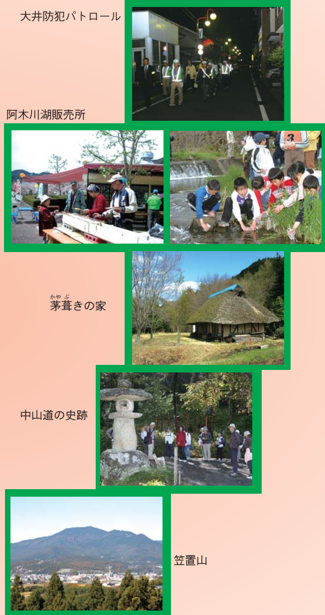
大井防犯パトロール

地域ではいろいろな活動が計画されています。あなたも地域の特色ある活動に参加しませんか