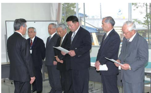
▲地域づくり事業を答申する地域協議会の皆さん

地域協議会で答申された「地域づくり事業」の平成18年度事業計画は54施策114事業、事業費の総額は1億