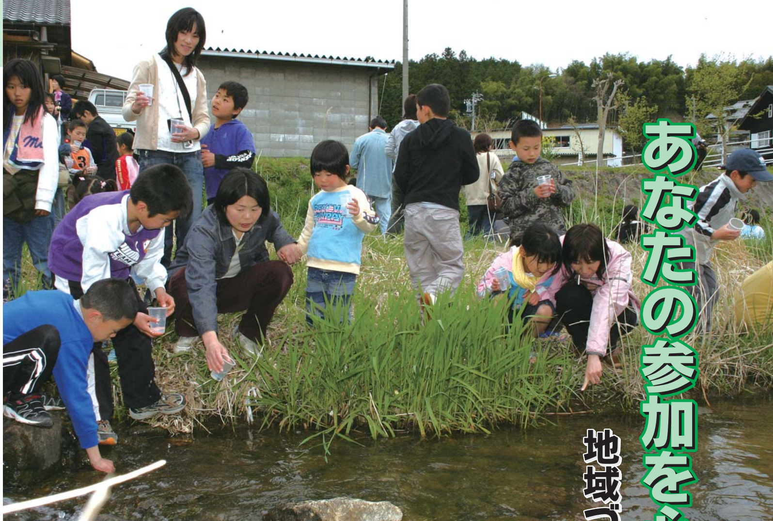
▲ホタルの幼虫放流（長島町まちづくり委員会）