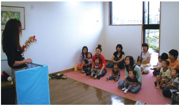
▲ボランティアによる人形を使ったお話(パペットシアター)

おはなしの部屋では、ボランティアの皆さんが、日替わりで読み聞かせや紙芝居、人形劇、絵描き歌など楽しい催しを開催しています。