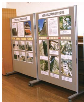
▲文化財を紹介するパネル展示