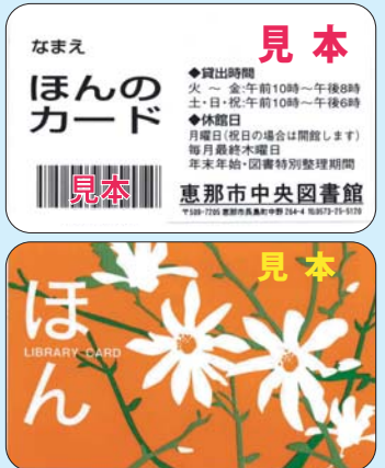
▲ほんのカード(表④裏⑤)

図書館利用カード「ほんのカード」を発行します。利用申込書に必要事項を記入の上、サービスカウンターへお申し込みください。 ※本人確認できるもの(学生証・運転免許証など)をお持ちください