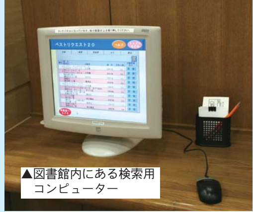
▲図書館内にある検索用コンピューター

お探しの本は、館内にある検索用コンピューターで調べることができます。所蔵している本の場合、どの