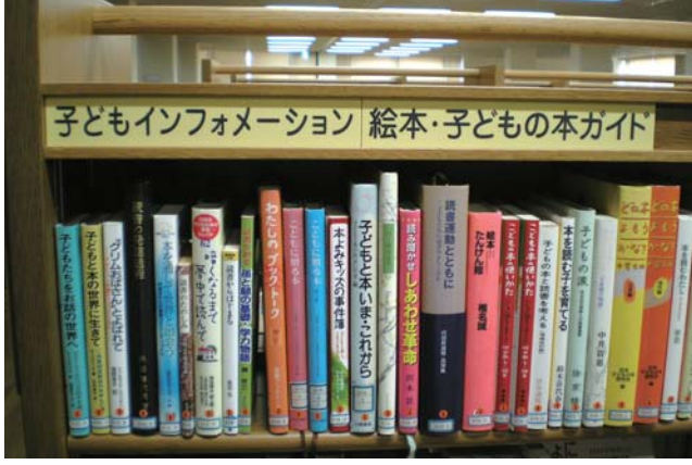
▶子育てに関する本をコーナーにまとめた子どもインフォメーション

妊娠・出産・育児から、絵本ガイド、家庭教育、学校教育、子どもの病気と健康など、子育てに関するさまざまな本が1つのコーナーに取りそろえてあります。