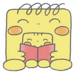
▲図書館のマスコットキャラクター「ブンさんとクンたん」