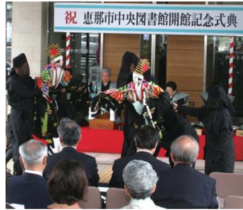
▲大井文楽保存会が「二人三番叟」を披露