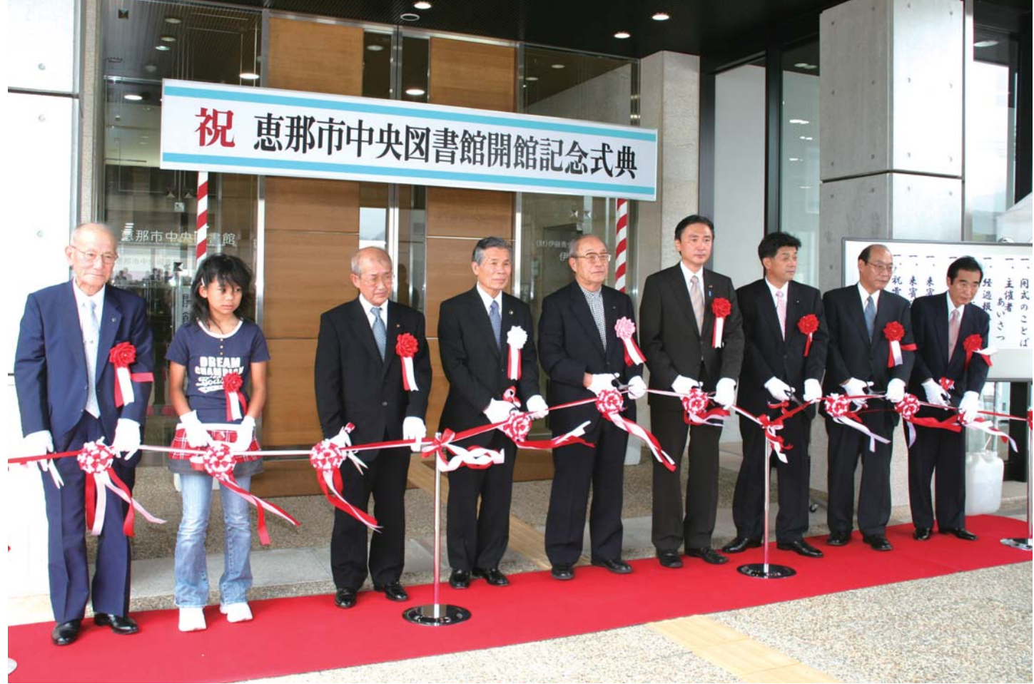
▶図書館の開館を祝いテープカットをする関係者