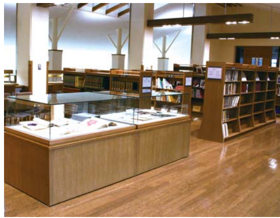
▲郷土の人物に関する資料なども展示