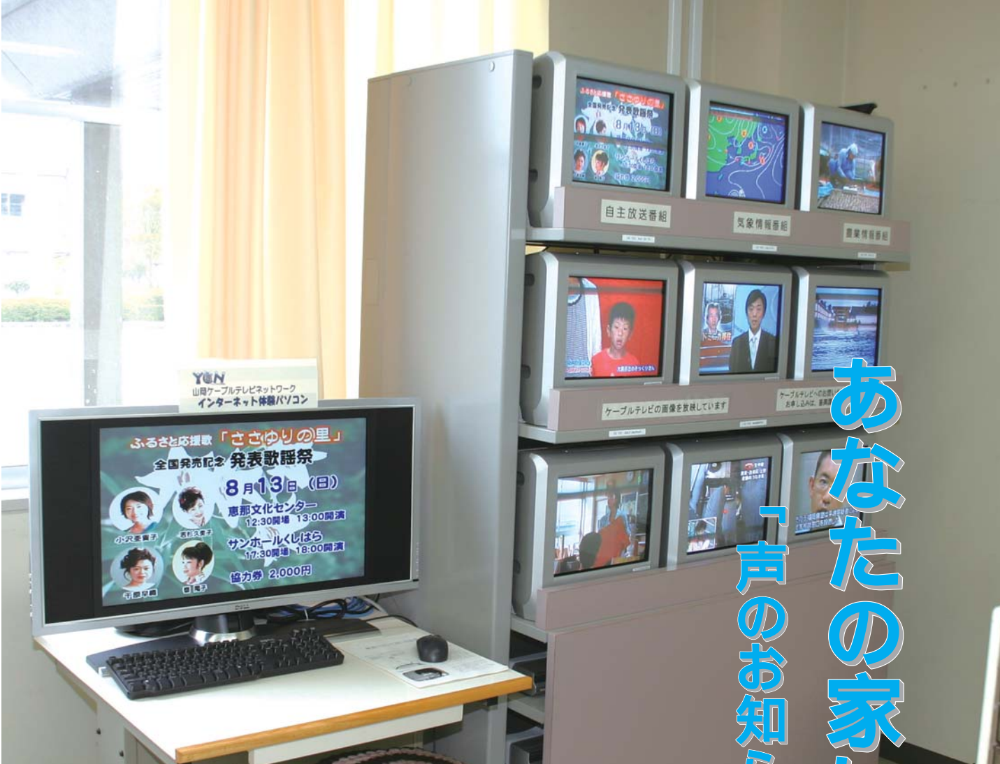
テレビ放送、地域の情報など、さまざまな情報を提供する山岡ケーブルテレビ

インターネットの通信環境では、市街地を除きADSL、光ケーブルに代表される高速なサービスが受けられない地域もあります。また市内では既にケーブルテレビのサービス地域もあり、地域の情報環境の不均一を解消します。