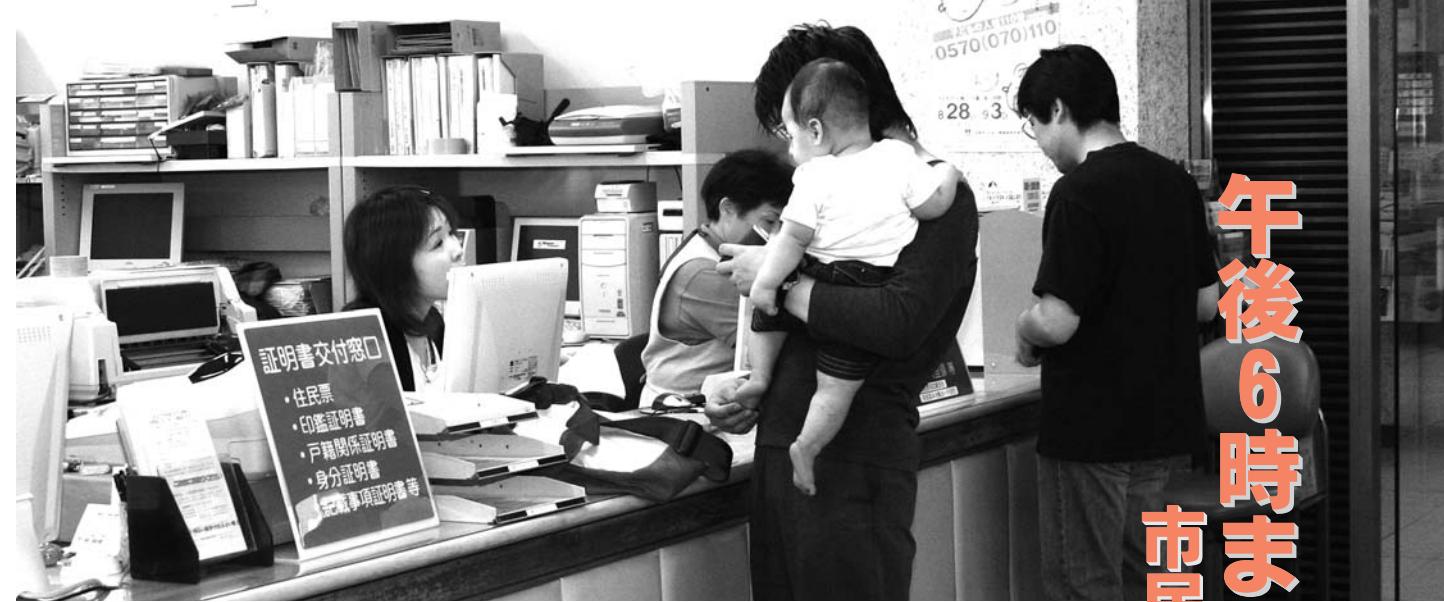
▲多くの皆さんにご利用いただいています市民課住民係の窓口

1・6割の方の「不満」に対しては、あいさつと同様に接遇などの職員研修を実施してさらに改善していきます。 □ 申請書の分かりやすさ 78・5割の方に満足をしていただいているものの、5・4割の方の「不満」に対しては、すべての申請書について、文字の大きさ・記入内容や押印などを点検してさらに改善する必要があります。 □ 用件にかかった時間 85・7割の方に「おおむね満足」をいただいています。1・7割の方の「不満」に対しては、確実な事務の執行を念頭に、簡素化できる部分について検討する必要があります。 □ 窓口サービス満足度 89・9割の方にほぼ満足をしていただいているものの、1・2割の方の「不満」に対しては、窓口サービス全般について改善して、さらに満足いただける職員の意識改革を実施していきます。 □ 窓口が開いている時間 満足度がすべての設問の中で最も低く61・5割でした。4割のお知らせのとおり、取りあえず市民課住民係のサービス時間を延長しますが、今後とも窓口サービスの時間や土日祝祭日の対応について検討する必要があります。 □ 問い合わせ 企画課行財政改革推進係（内線332）