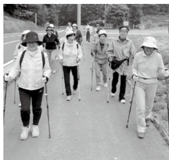
▲みんなで楽しくウォーキング