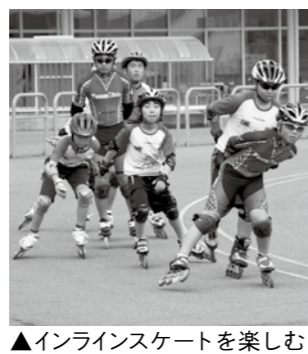
▲インラインスケートを楽しむ