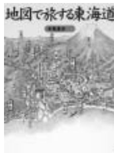
地図で旅する東海道