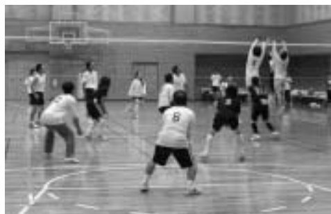
市民大会バレーボール競技