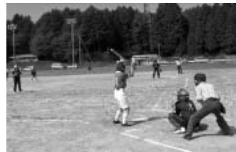
市民大会ソフトボール競技