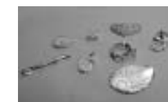
かわいいアクセサリ-

あなただけの世界に一つのオリジナルアクセサリ-を作ってみませんか。講師の作品も販売します。