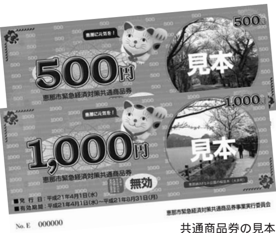
共通商品券の見本

定額給付金は、市内の経済対策も目的としています。本紙の表紙でも紹介しているように、4月1日から