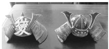
作品見本のかぶと