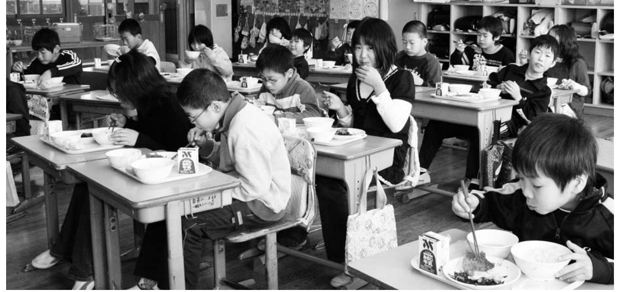
大好きな給食を食べている児童ら（岩邑小学校で）

食材の高騰のため、新年度から給食費を値上げさせていただくことになりました。値上げの幅は、小学校で1食当たり35円です。昨年度からの材料価格の高騰の中、献立や食材の調達など、工夫を重ねてしのいできました。しかし、それも限界。このままでは学校給食摂取基準 1 から、大きく離れてしまう恐れが出てきました。そこで、教育委員会などで審議され、給食費の改定を決定しました。保護者の皆さんには負担をお掛けしますが、よろしくご理解ください。 問い合わせ 市学校給食センター 26 1633