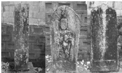
今回、調査をした三基の石造物