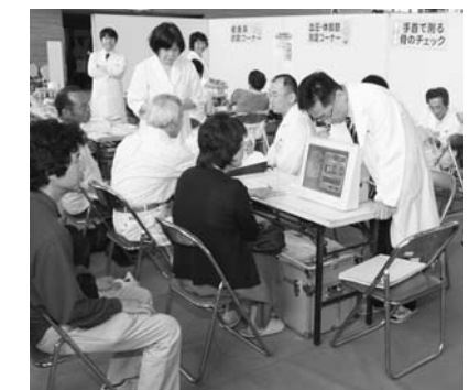
昨年の健康祭の様子

ど ▷スポーツ部門=軽スポーツ体験、トレーニング機器無料体験、テニスコート無料開放、ミナモと一緒に熱気球体験など 交通アクセス 恵那駅前からシャトルバスを運行します。恵南地区は、マイクロバスを運行します。 詳しくは5月25日の新聞折り込み