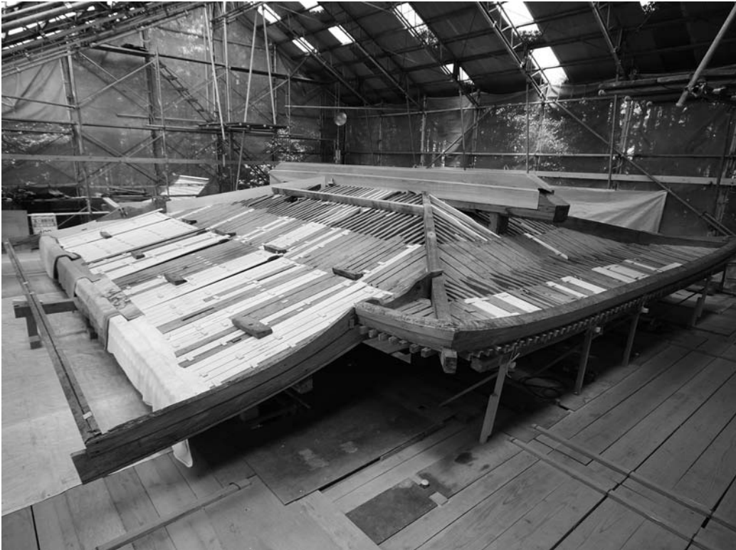
木材の補修が進み屋根が徐々に姿を現し始めた武並神社本殿（平成21年4月30日撮影）