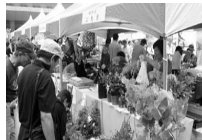
昨年の観光物産展の様子