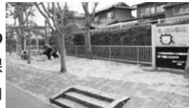
整備されたライオン広場